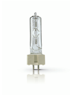
XPPR XDMSR 0025