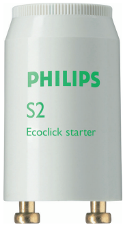
LPPR STARTER PHL 0004