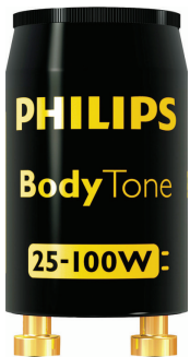
BodyTone 25-100 W, BK