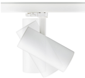
ST315T PSU WH Greenspace Accent Projector mini side view