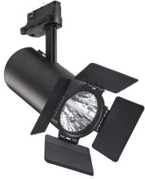
ST315T BK Greenspace accent Projector mini + ST710Z BD BK Barndoor