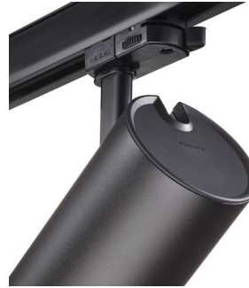
ST315T PSU BK Greenspace Accent Projector mini back view hinge detail