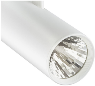
ST315T PSU WH Greenspace Accent Projector mini lens detail