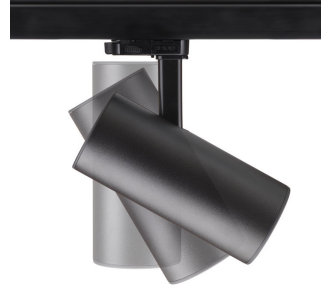
ST315T PSU BK Greenspace Accent Projector mini side view