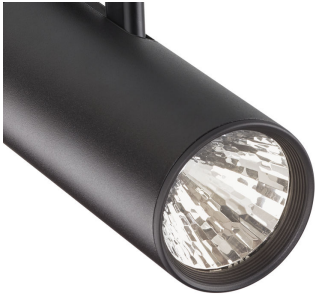
ST315T PSU BK Greenspace Accent Projector mini lens detail