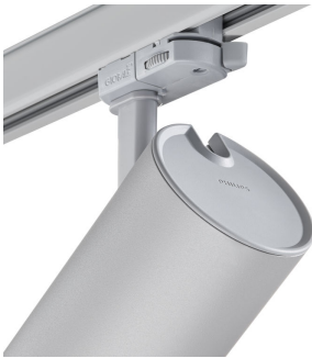
ST315T PSU SI Greenspace Accent Projector mini back view hinge detail