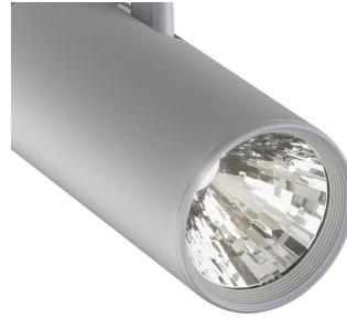
ST315T PSU SI Greenspace Accent Projector mini lens detail