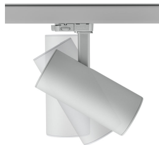
ST315T PSU SI Greenspace Accent Projector mini side view