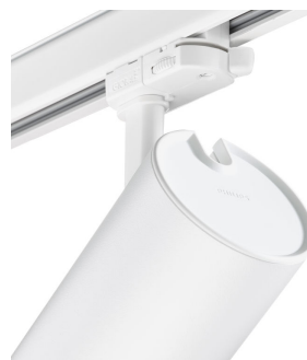
ST315T PSU WH Greenspace Accent Projector mini back view hinge detail