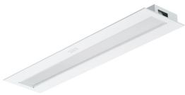
FlexBlend RC340B W30L120 U4