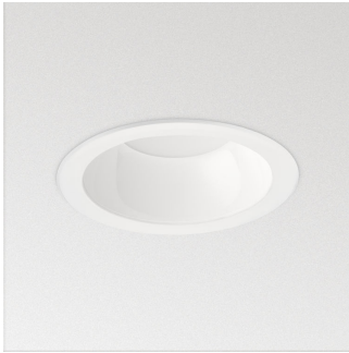
Coreline Downlight Gen4-DN140B LED10S WR