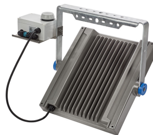
InterAct ready version