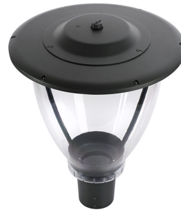
CityCharm Fluid with top socket