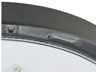
TownTune ASY DR BDP266