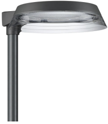
TownTune ASY DR BDP266