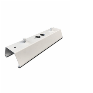
9MX056 CP WH