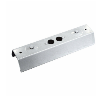
9MX056 CP SI