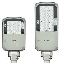
AluRoad gen2 Pro family bottom view