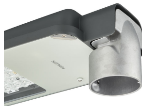
AluRoad gen2 Pro 76mm spigot and tilt indicator