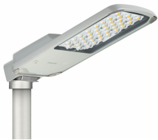
AluRoad gen2 Medium Pro product picture