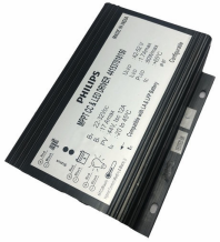
ComboCC Gen 4.0