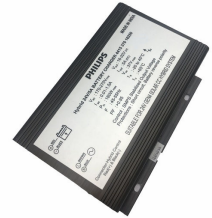
ComboCC Gen 4.0 Hybrid Supply Unit