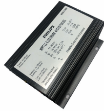
ComboCC Gen 4.0