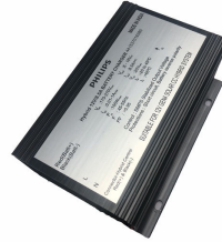
ComboCC Gen 4.0 Hybrid Supply Unit