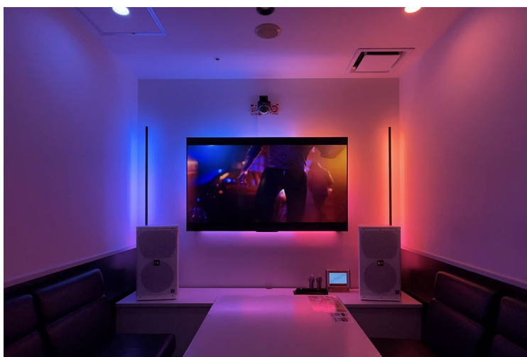
スーパー没入ルーム（渋谷南口駅前店）

エンターテインメント演出に定評のある Philips Hue の特長を活かし、カラオケの映像とのシンクロにより没入感を最大限に楽しめる空間を提案します。