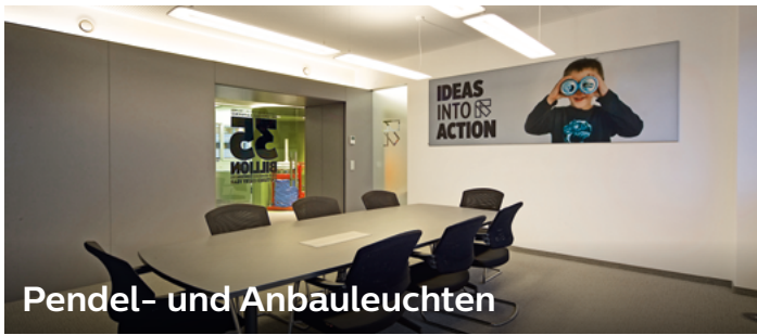
Pendel- und Anbauleuchten

Bitte überprüfen Sie jedes gewünschte Einzelprodukt, ob es förderfähig ist. In einigen Fällen erfüllen nicht alle Produkte der Familie die Förderkriterien.