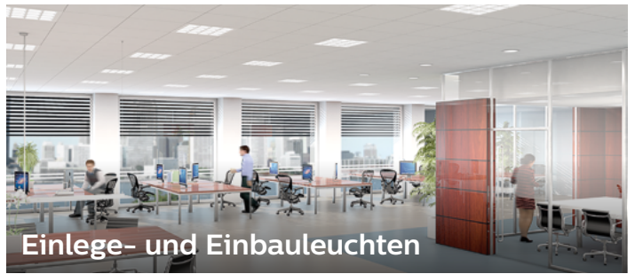
Einlege- und Einbauleuchten