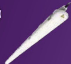
Ledinaire waterdicht WT065C