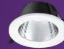
Ledinaire inbouw downlight