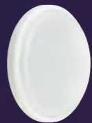
Ledinaire wandmontage WL070V