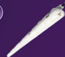
Ledinaire waterdicht WT065C