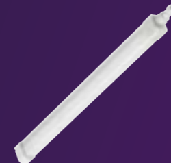
Ledinaire waterdicht WT060C