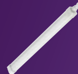
Ledinaire waterdicht WT060C