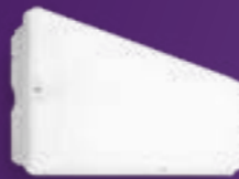
Ledinaire vierkant wandmontage