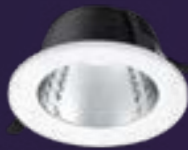
Ledinaire inbouw downlight