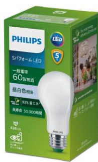
S パフォーマンス LED 電球 60W 形相当 昼白色