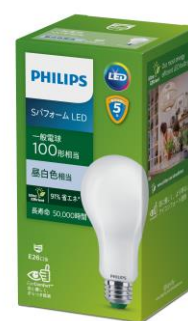
S パフォーマンス LED 電球 100W 形相当 昼白色