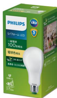
S パフォーマンス LED 電球 100W 形相当 電球色