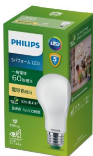
S パフォーマンス LED 電球 60W 形相当 電球色

世界的な照明専門メーカーの技術・知見をもとに、最大 90%のエネルギー削減*1 でサステナビリティへの貢献を実現しました。一方で、自然光に近い演色性と白熱電球のようなデザインにより、暮らしの様々な場面に馴染みやすい製品となっています。